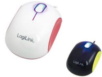
Mini ratones USB 1000dpi