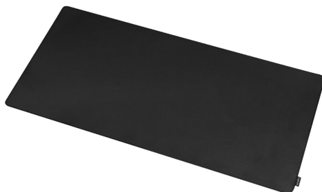
Alfombrilla Gaming XXL 890X435MM