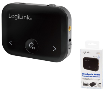
Receptor /emisorde Audio Bluetooth Con Autonomia de hasta 10h