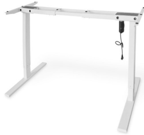
Base Escritorio regulable eléctrico 70/120cm