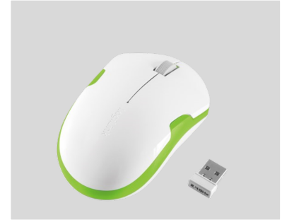
Mini Ratones inalámbricos 1200dpi