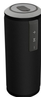
Altavoz Bluetooth 12W