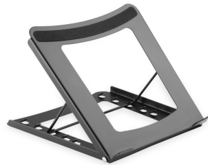
Soporte Base Ajustable 5 Posiciones