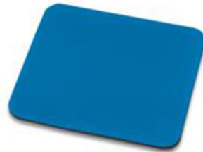
Alfombrilla Azul 248X216MM