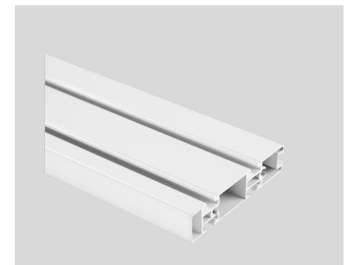
Rieles 120cm largo