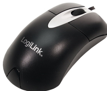
Raton óptico 800 dpi