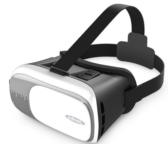
Gafas realidad virtual