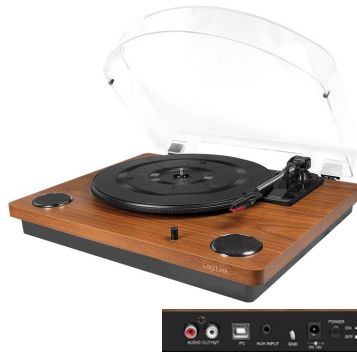
Giradiscos con capturadora audio