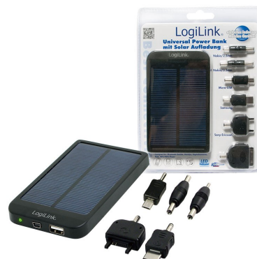
Cargador Solar Universal 800mAh 7w con 7 Adaptadores