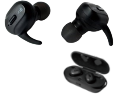
Auricular Botón Bluetooth