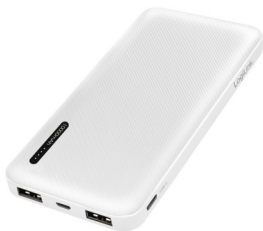
P.BANK 10000mAh 2USB