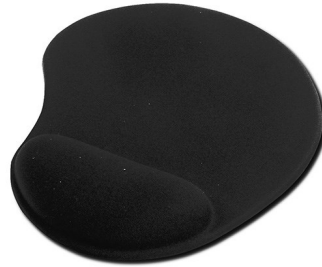
Alfombrilla Negra ergonómica 225X180X3MM