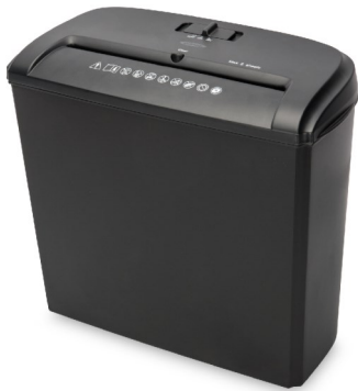
Destructora papel 5 Hojas 7mm corte