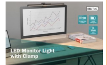
Lampara USB monitor 5w 250lm