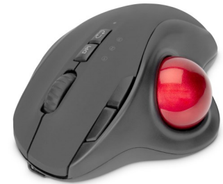
Ratones inalámbrico 2400dpi ajustable Bola 8 botones, con batería cargador C