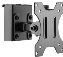
Soporte Monitor pivotante