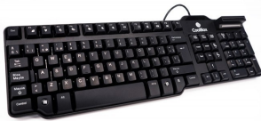
Teclado USB + Lector DNI