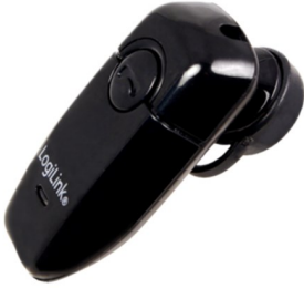
Auricular Mono Bluetooth