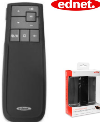
Puntero laser presentación inalámbrico