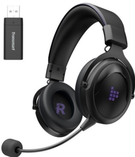
Auricular 2.4Ghz inalámbrico Carga Tipo C Gaming