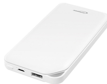
P.BANK 8000mAh 1USB