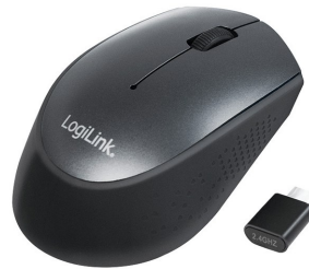
Ratón inalámbrico 1200dpi USB C