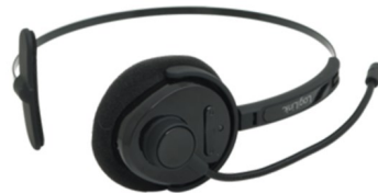
Auricular Bluetooth Mono diadema