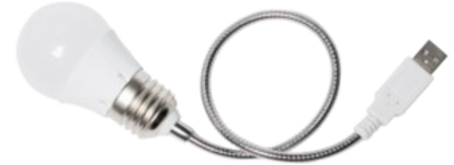
Lampara LED USB Extensible