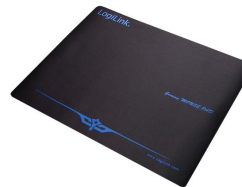
Alfombrilla Negra Gaming XL 400X300x2MM