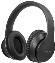
Auricular Bluetooth 5.0 ANC