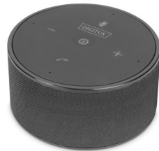
Altavoz Multiconferencias 10W Con función TWS