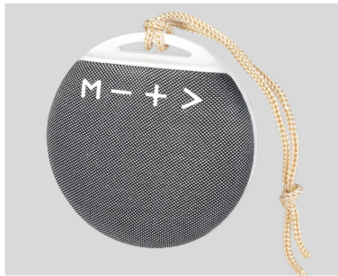
Altavoz Bluetooth +FM+SD