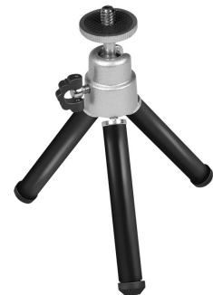
Mini trípode portátil