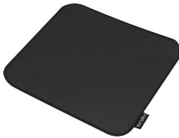
Alfombrilla Gaming M 250X220MM