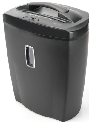
Destructora 10 Hojas Partículas