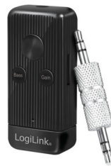
Receptor de Audio Bluetooth Con Autonomia de hasta 5h