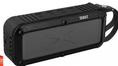
Altavoz Bluetooth 10W