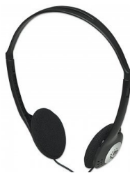
Auricular St Negro