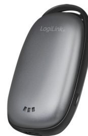
P. BANK solar 4000 mAh +CALENTADOR MANOS