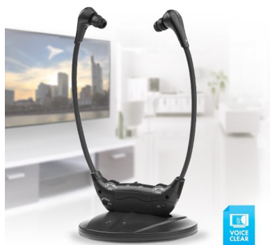
Auricular Inalámbrico 100m