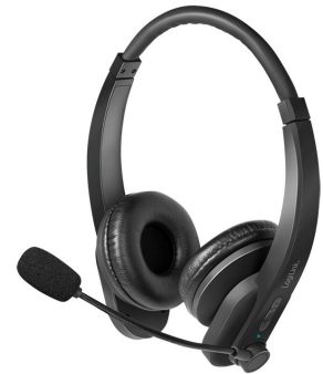
Auricular Bluetooth 5.0 Carga Tipo C