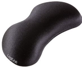
Reposa muñecas Ratón 145MM