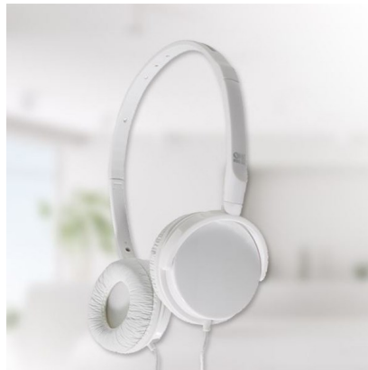
Auriculares manos libres Blanco