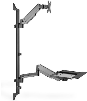
Soporte de pared 1 Monitor hasta 32" + bandeja