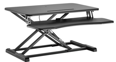
Estación de trabajo abatible sobremesa