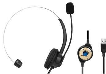
Auricular Mono USB