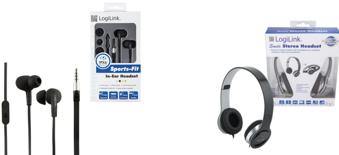
Auricular manos libres Gel watter resistant