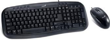
Combo teclado+ ratón USB