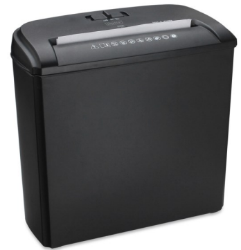
Destructora 5 Hojas Partículas