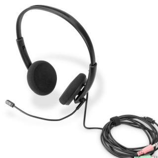
Auricular St Reducción ruidos Cable 2.00m