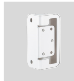
SOPORTE PARED (2 unid)