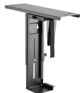
Soporte pc de bajo mesa ajustable