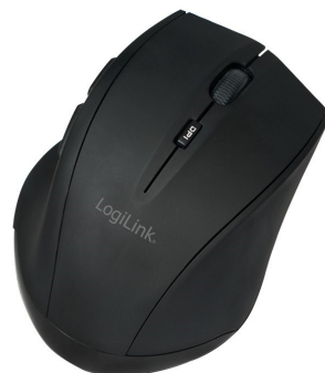
Ratón inalámbrico Bluetooth 1600dpi 5 teclas