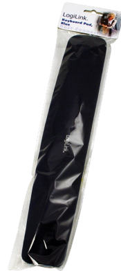
Reposa muñecas Teclado 475x80x20MM