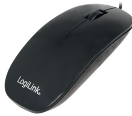
Ratones Slim USB 800dpi