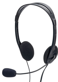
Auricular PC ST