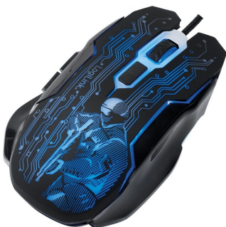
Ratón Gaming 6 botones 2400Pdi ajustable