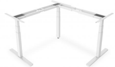
Base Escritorio regulable eléctrico esquina 60/125cm