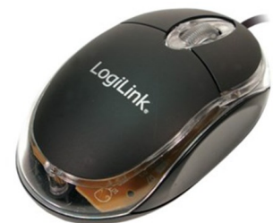
Mini ratón óptico 800dpi