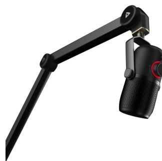
Soporte Telescopico micrófono usb