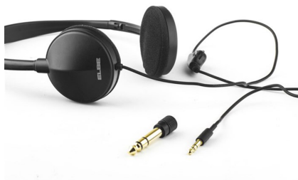
Auricular Diadema cable 5m