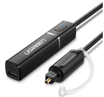
Emisor de Audio Toslink Bluetooth 4.2 Alim micro USB