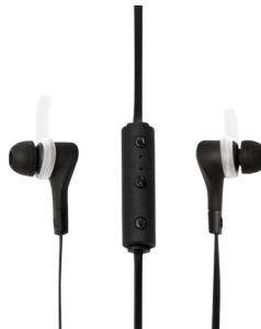
Auricular Sport Bluetooth