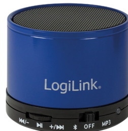
Altavoz Bluetooth+SD Azul