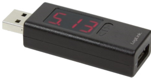
Medidor Tensión USB