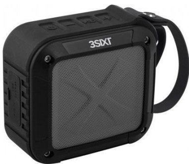
Altavoz Bluetooth 5W