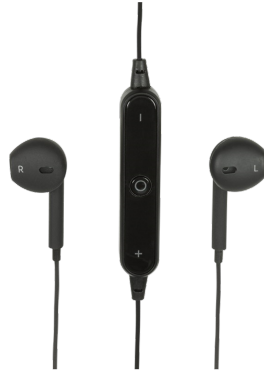
Auricular Sport Bluetooth