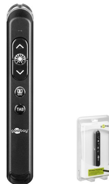
Puntero laser presentación inalámbrico