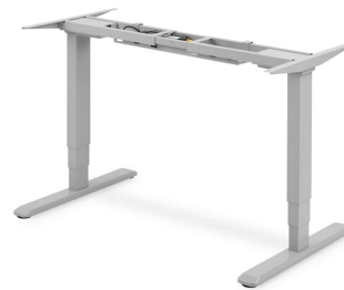
Base Escritorio regulable eléctrico 63/125cm