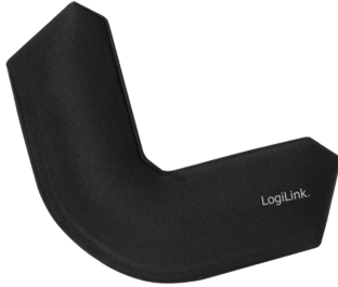
Reposa muñecas angulo 90 grados 240MM