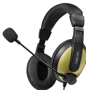
Auricular PC Espuma