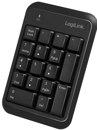
Teclado numérico Bluetooth