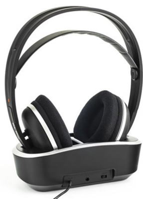
Auricular Inalámbrico 100m