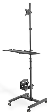
Estación de trabajo móvil altura 178 cm