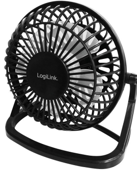
Ventilador USB 90mm