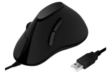
Ratón USB Vertical 1000dpi