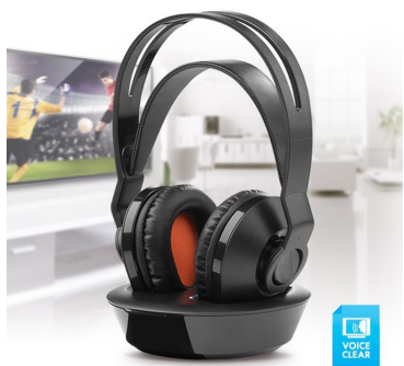
Auricular Inalámbrico 100m