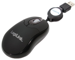
Mini Ratón USB Retráctil 800dpi