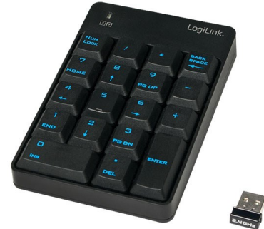
Teclado numérico USB