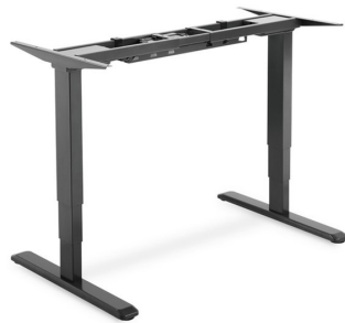
Base Escritorio regulable eléctrico 63/125cm