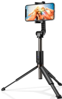
Tripode Selfy Bluetooth