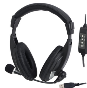
Auricular PC USB