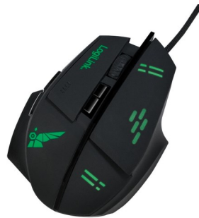
Ratones Slim USB 1200//3200dpi Gaming