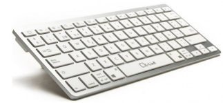
Teclado Bluetooth 3.0 Gris plata