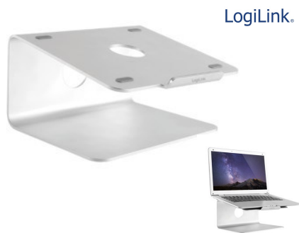
Soporte Base Aluminio 240X235MM