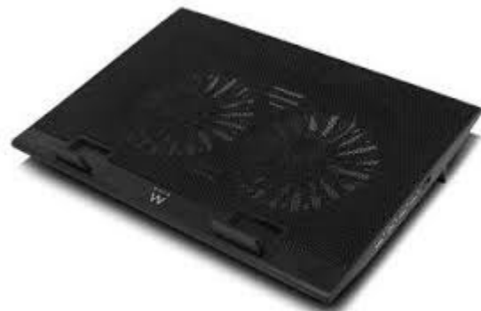
Base Refrigeración para Portátil