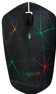
Ratón inalámbrico Bluetooth iluminado 1600dpi 4 teclas