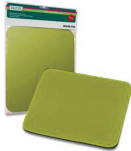
Alfombrilla Amarilla 248X216MM