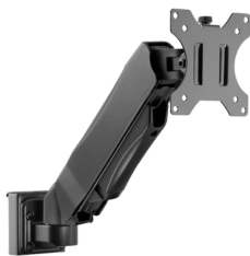
Soporte Monitor Brazo Gas