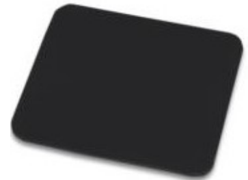
Alfombrilla Negra 248X216x2MM