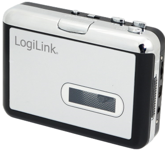
Casete digitalizador a USB