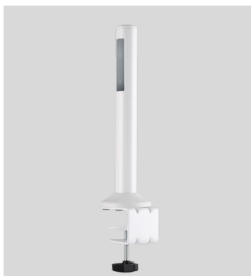
Soporte Sobremesa (2unid)

Totalmente modular de fijación a sobremesa o pared.