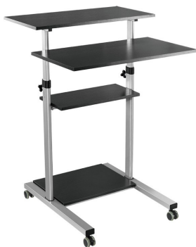
Estación de trabajo móvil altura 820-1260 cm