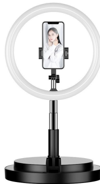
Tripode con anillo luz 170cm