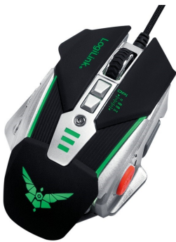
Ratones Slim USB 1200//3200dpi Gaming