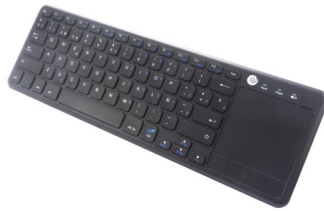
Teclado Inalambrico con Touchpad