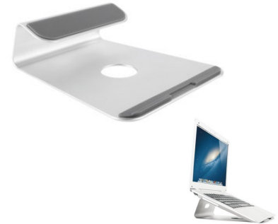
Soporte Base Aluminio 239X210MM