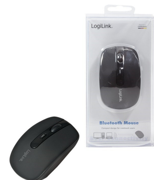
Mini Ratón inalámbrico Bluetooth 1600dpi