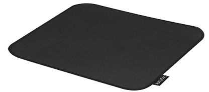
Alfombrilla Gaming XL 455x400