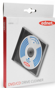
CD limpiador de Lectores