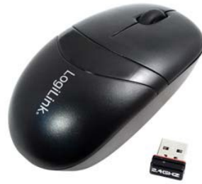
Ratón inalámbrico 1000dpi