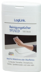
Toallitas limpieza LCD/LED